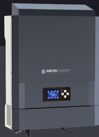
IMEON 3.6 Jusqu'à 4kWp Mono-phasé