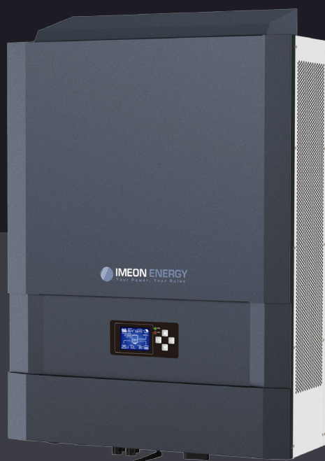
IMEON 9.12 Jusqu'à 12kWp Triphasé